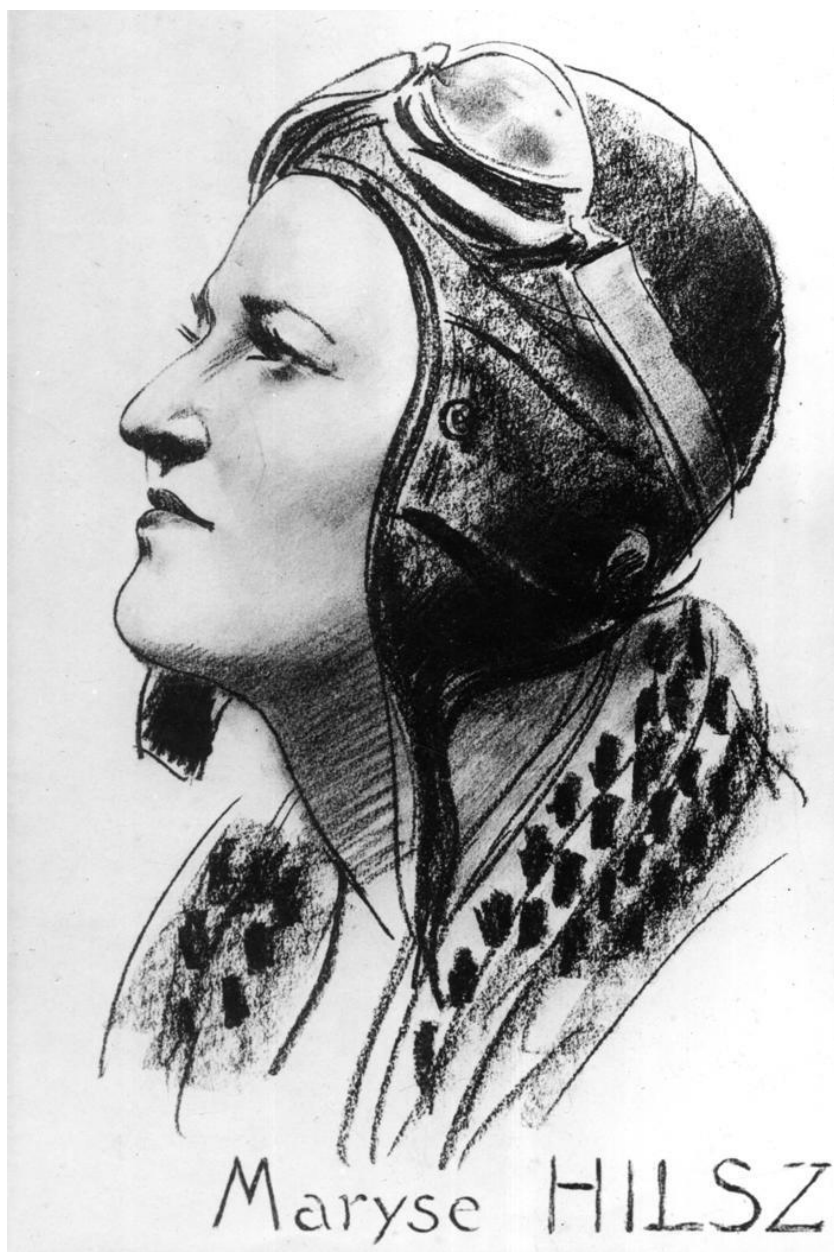
Maryse HILSZ et son Siebel Martinet 204