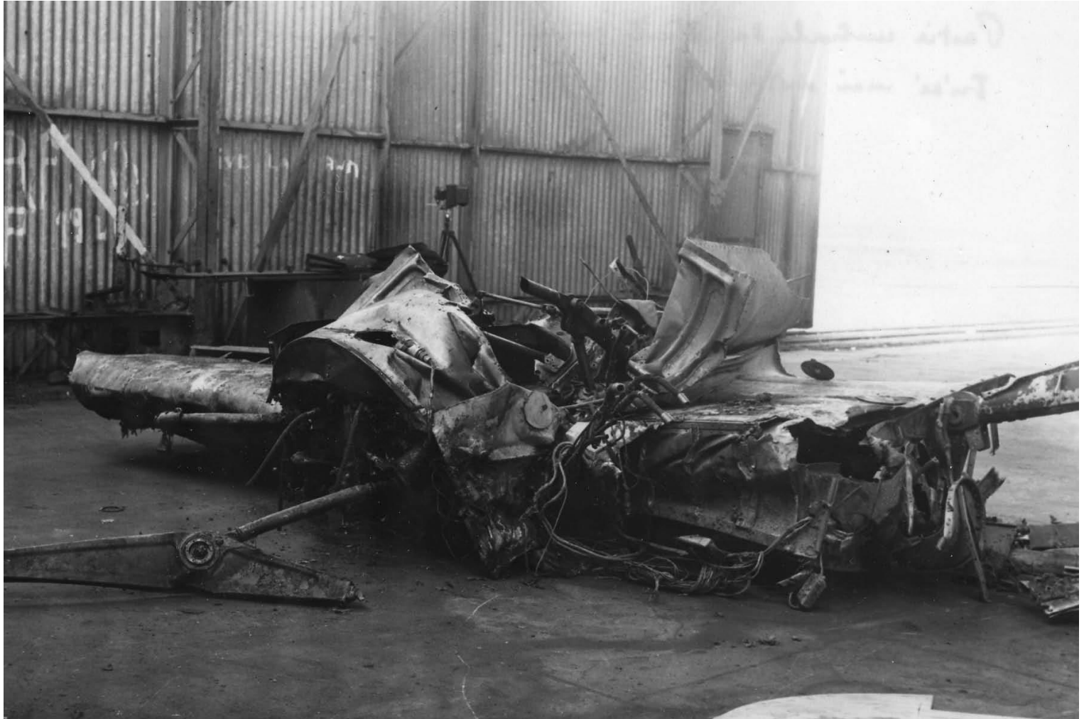
Partie centrale aile gauche - Bras du bâti détaché réajusté