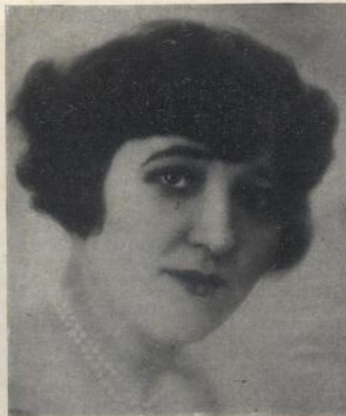
L'AVIATRICE MARYSE HILSZ QUI A BATTU LE RECORD FÉMININ DU MONDE D'ALTITUDE EN S'ÉLEVANT A 10.200 MÈTRES.