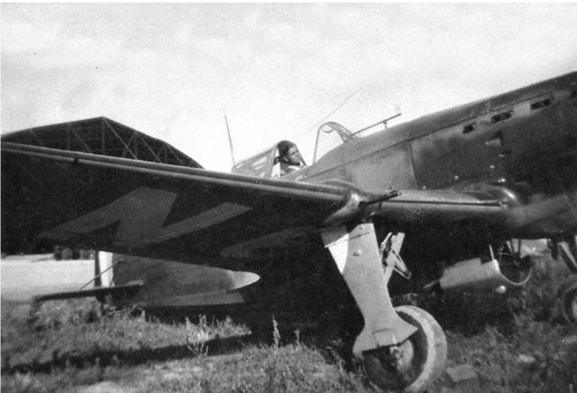
Paul KACHLER à bord d'un Morane 406 du GC III/6

Nota : Le hangar au second plan n'est pas situé à Chartres