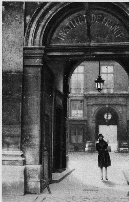
Titayna et le Bouddha sont allés rendre visite au plus sérieux des établissements parisiens : l'Institut de France.