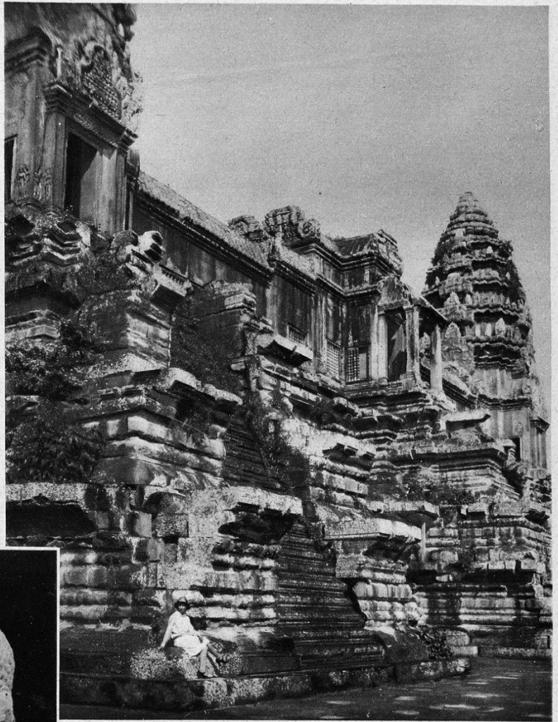
Vue de la troisième et dernière enceinte, au milieu du temple d'Angkor-Vat.

Je bouscule les garçons anamites, secoue mon boy, boucle mon sac, et me voici au volant. Il est cinq heures du soir. Saïgon est à 630 kilomètres. Je dois passer les fleuves sur des bacs, changer d'auto à Pnom - Penh. Pour le cas où je serais si-