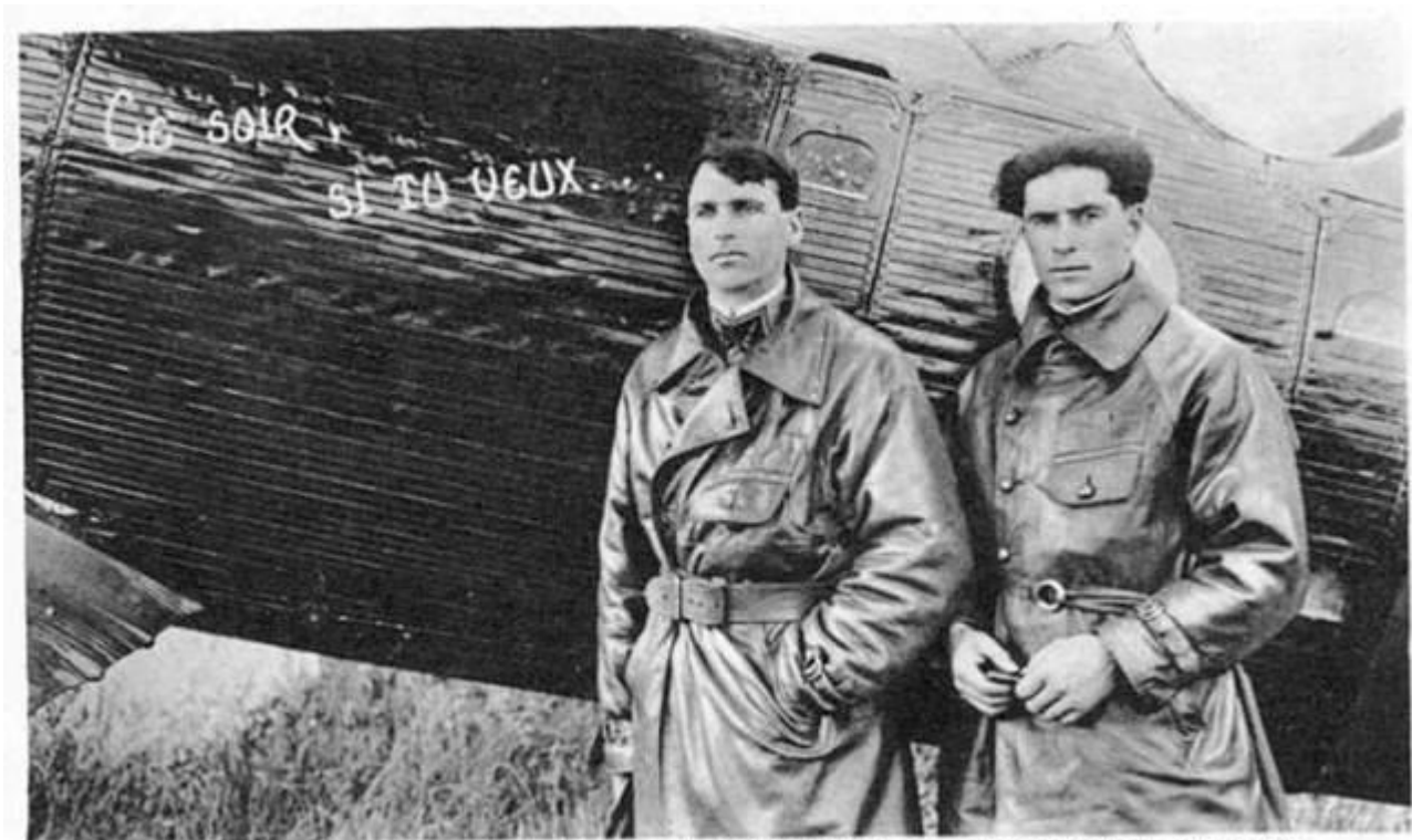
10. - Circuit des Capitales du Nord de l'Europe, par WEISS et LATAPIE.