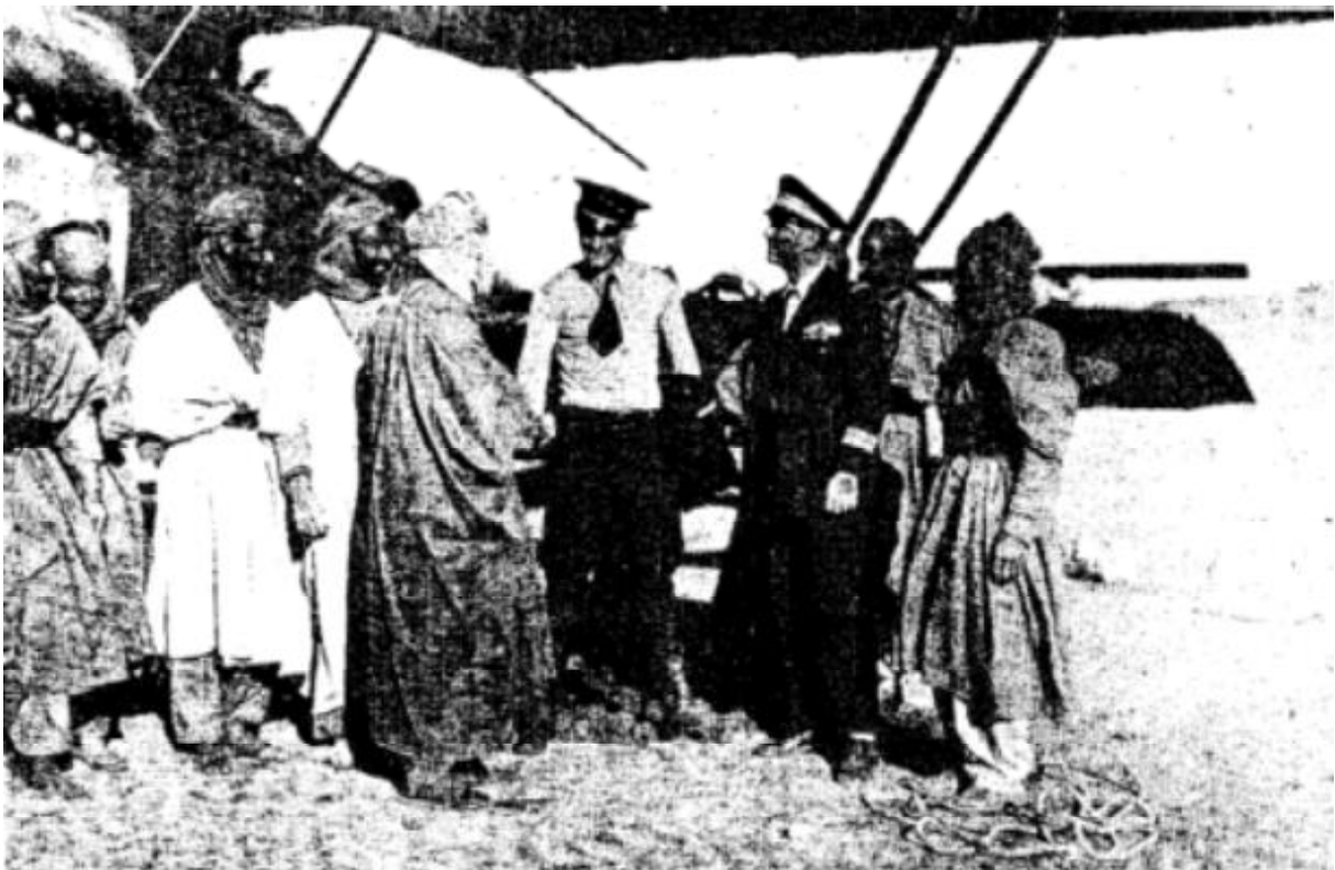
La causette à l'atterrissage. - Les Sahariens entourent les aviateurs et s'intéressent à la liaison postale Alger-Gao.