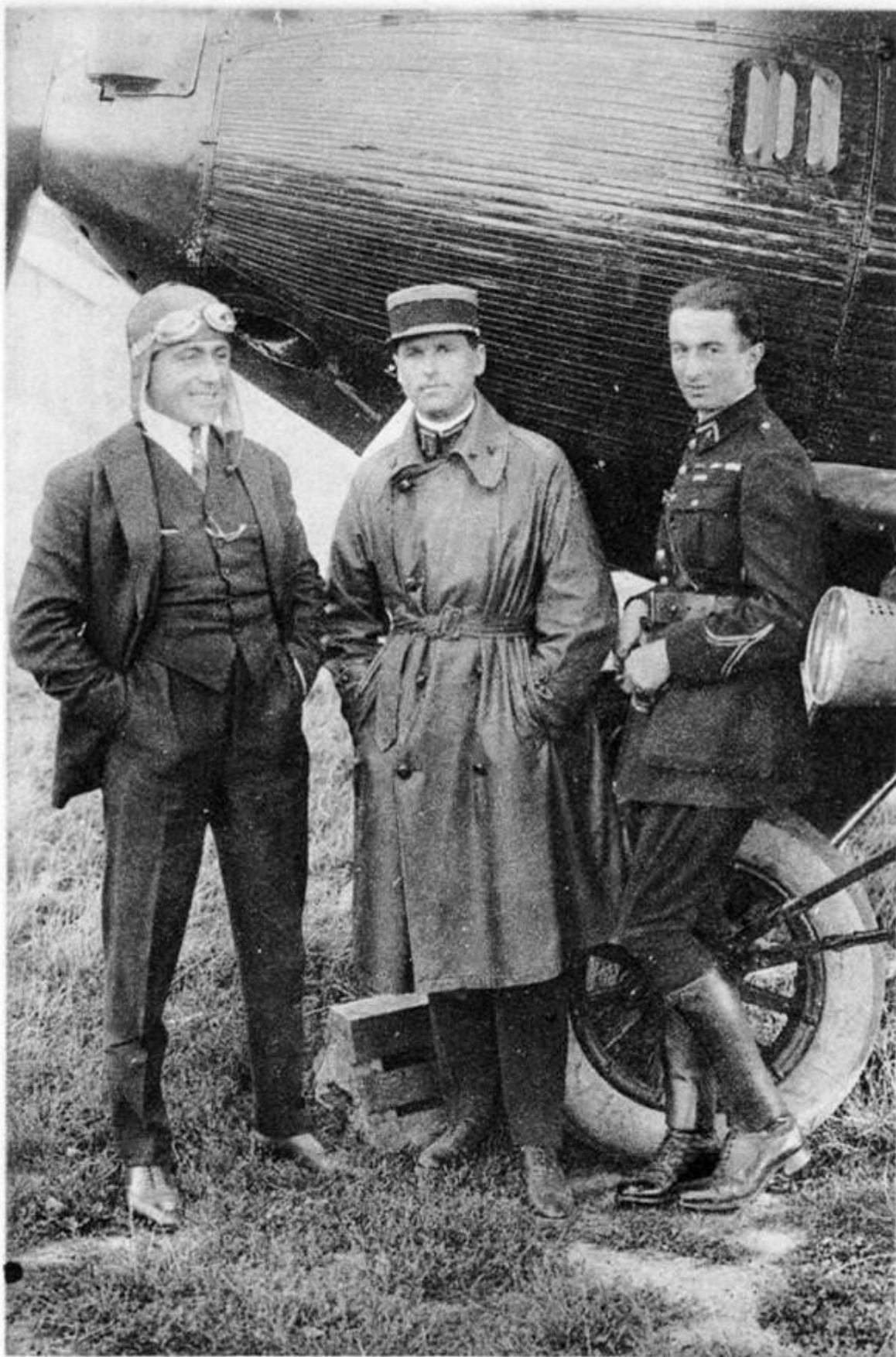
8. Un trio de Grands Pilotes de Bréguet. COSTES, le Commandant Pierre WEISS et le Capitaine René de VITROLLES.