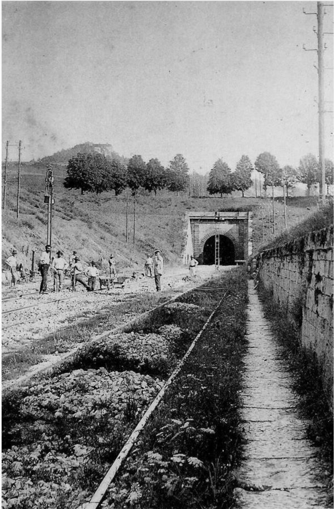
Côté Nord Entrée du Grand Tunnel de P. L. M. à Blaisy-Bas (100 mètres de long)