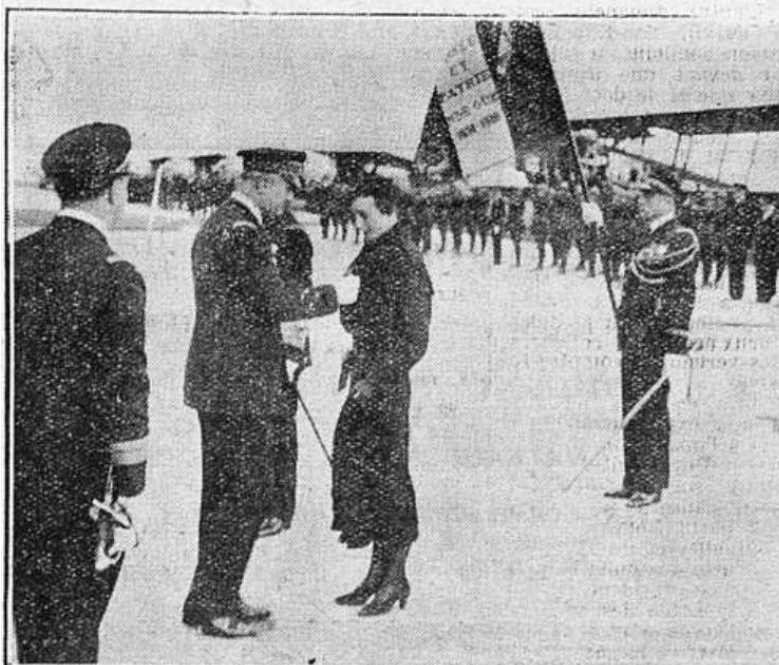
Le général de Goys remet à M me veuve du Boucher la croix de la Légion d'honneur conférée à titre posthume au lieutenant du Boucher, tué le 18 août 1932, pendant les manœuvres de Mourmelon.