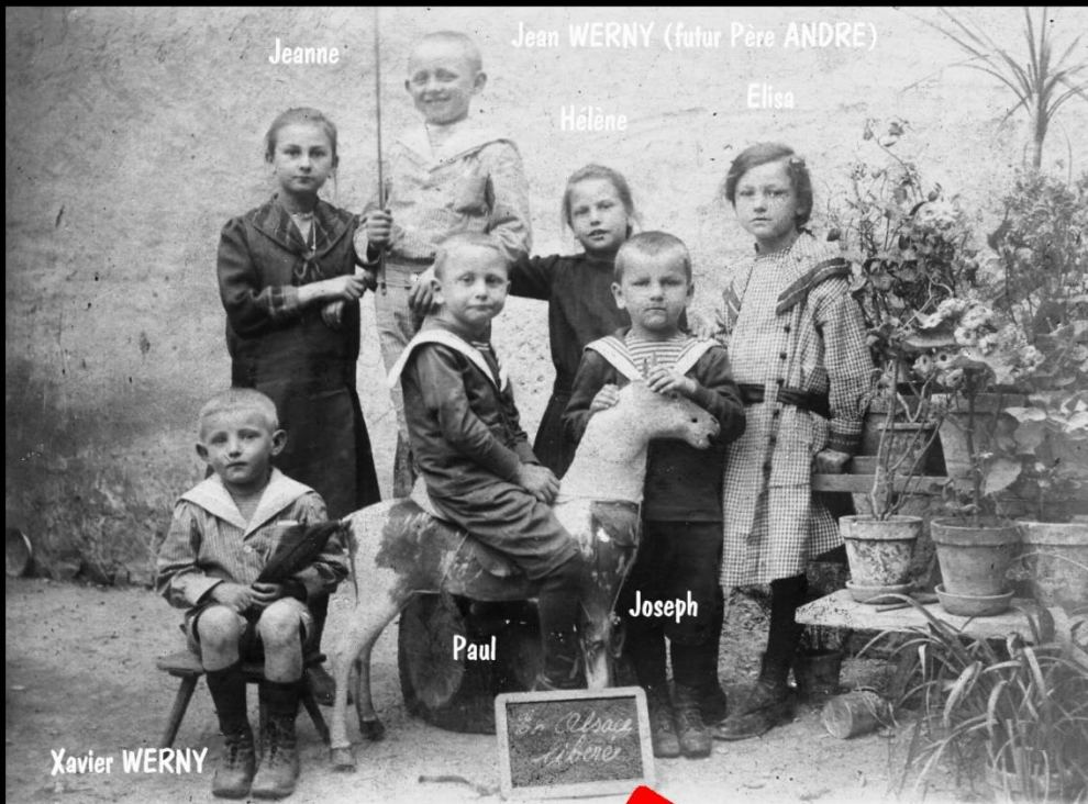
Marckolsheim - Après le 11 novembre 1918