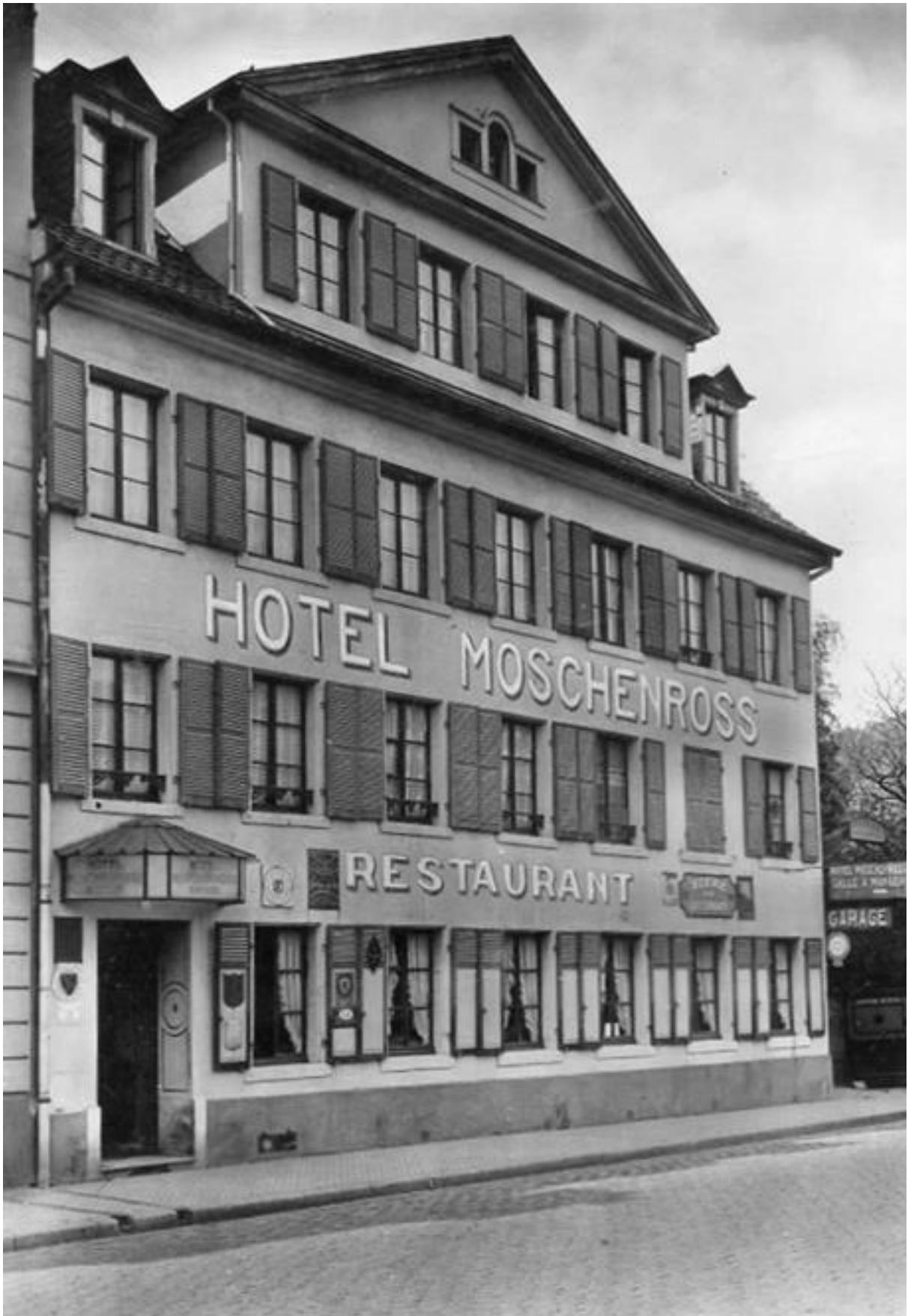
Hôtel – Restaurant Moschenross à Thann