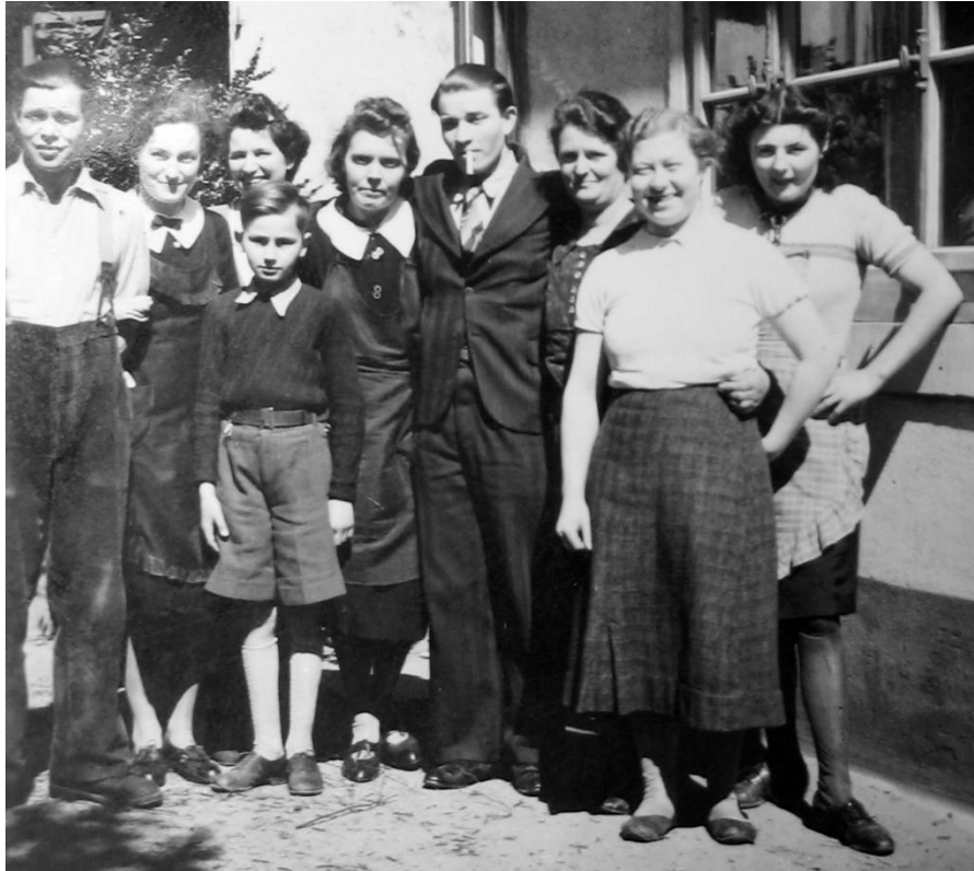
Une partie de l'équipe du Moschenross après la Libération de la ville de Thann (1945)