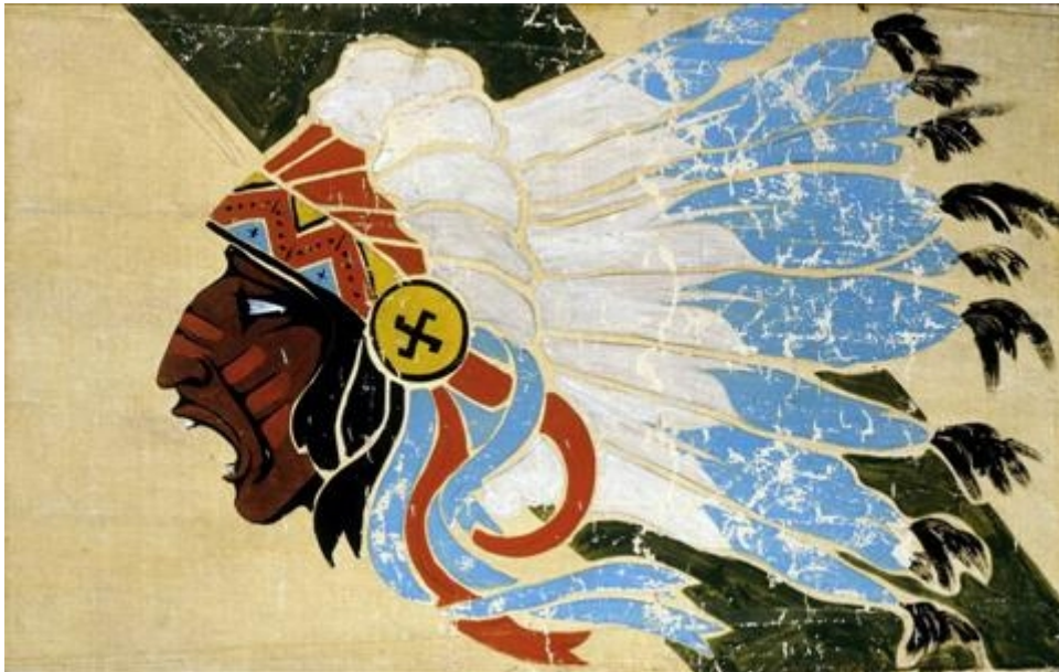
L'insigne des sioux - Escadrille « La Fayette » - GC II/5

Mais on reconnaît sur la poitrine du pilote l'insigne des sioux, de la troisième escadrille « La Fayette » du groupe de chasse GC II/5, qui était équipée de Curtiss H-75A-1 et qui se trouvait alors sur l'aérodrome de Toul – Croix-de-Metz (54).