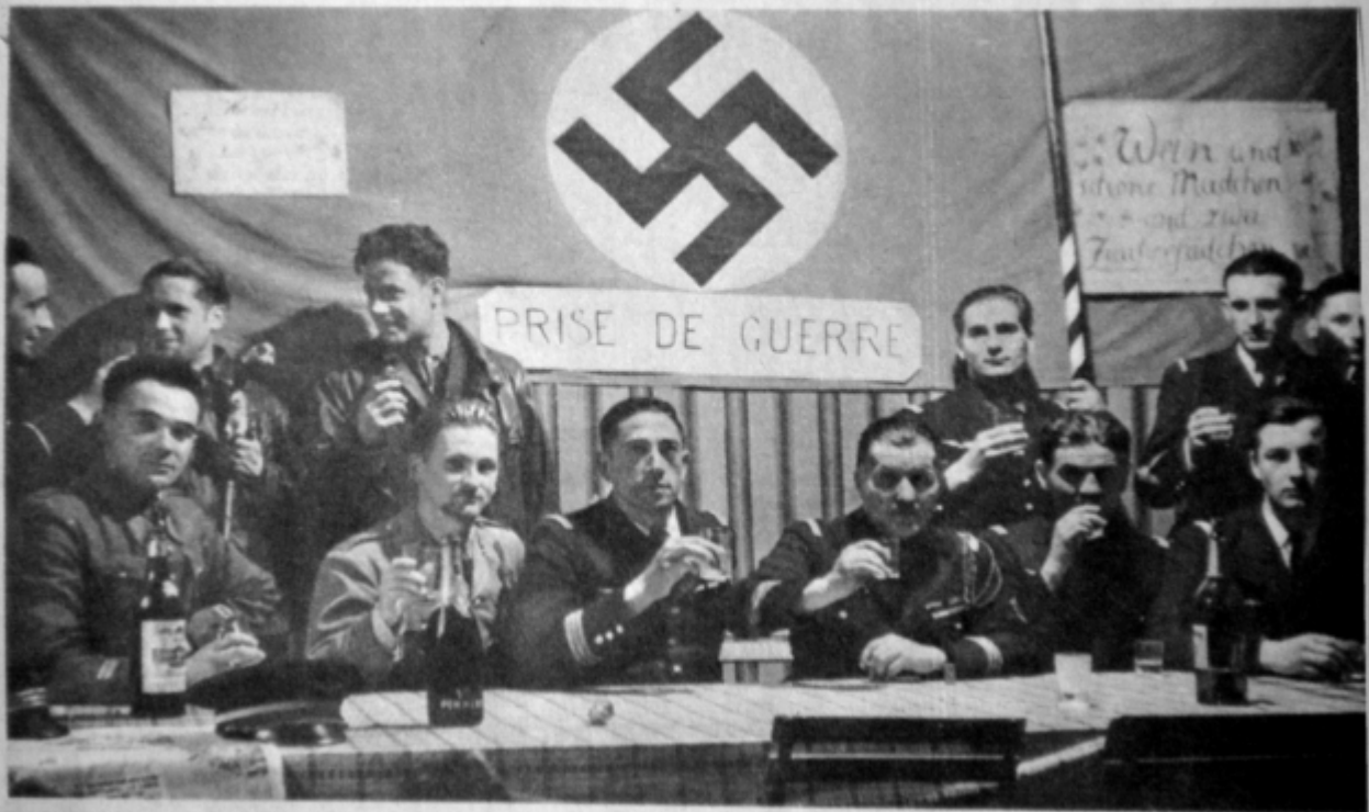
LA POPOTE DE L'ESCADRILLE EST DECOREE AVEC LES TROPHES PRIS A L'ENNEMI, INSIGNES DES AVIONS ALLEMANDS ABATTUS DANS NOS LIGNES ET RECUEILLIS PAR LES VAINQUEURS. LE DECOR S'ENRICHIRA...