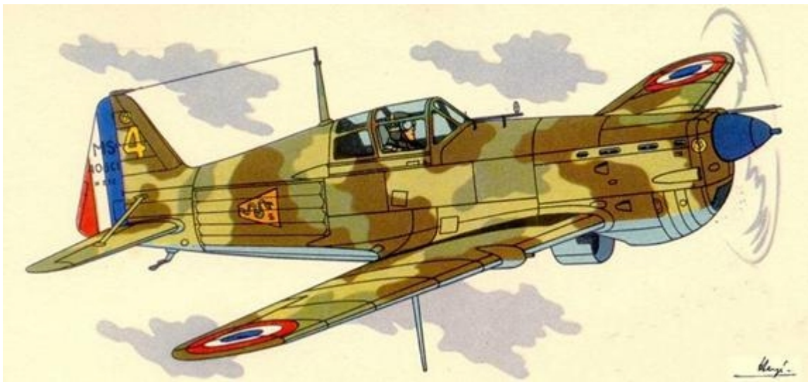
Morane Saulnier MS 406 de la 1 ère escadrille du GC I/3 Dessin de Hergé