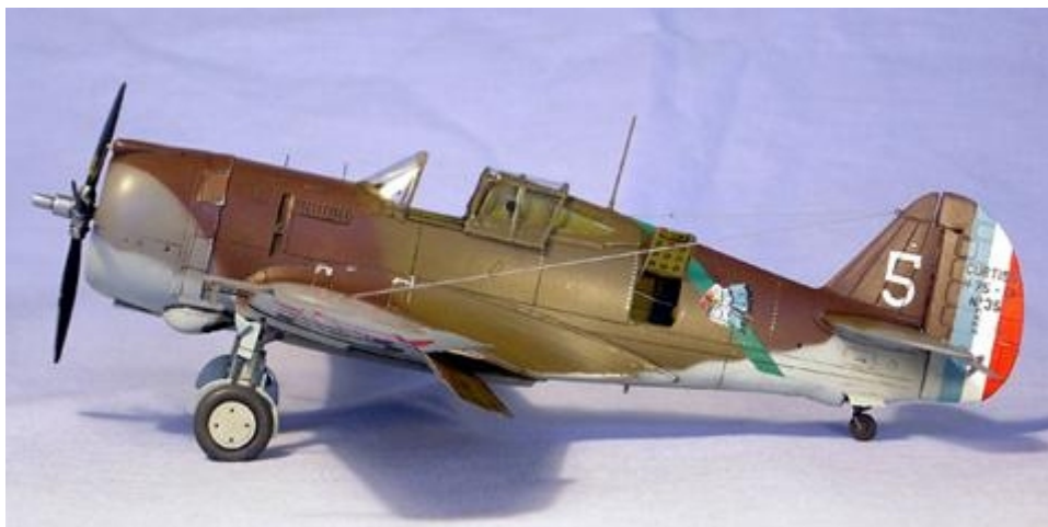
Curtiss H-75 de l'escadrille « La Fayette »