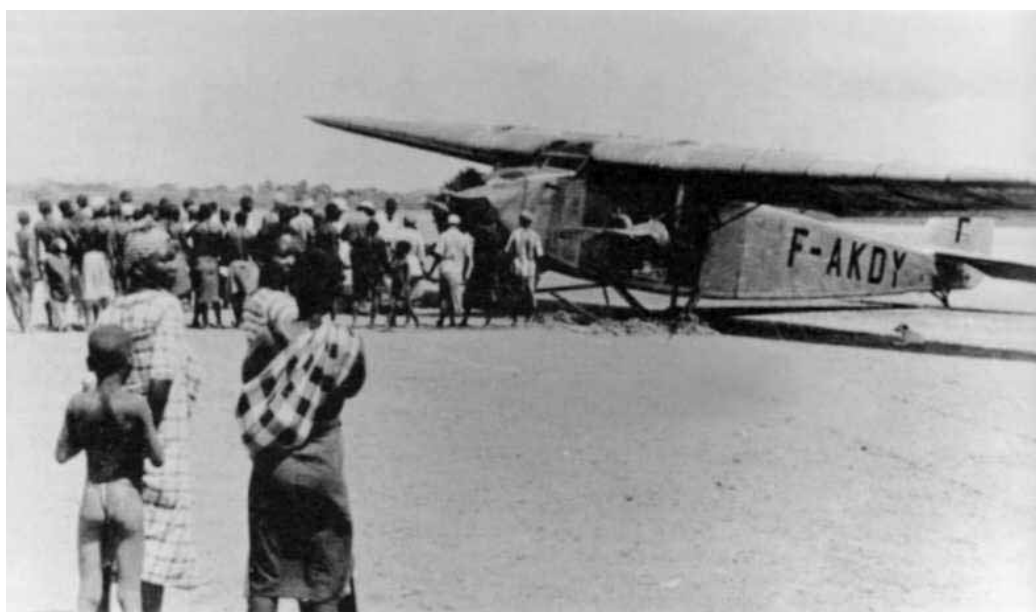
Déjà, probablement fin 1934, un autre appareil, le SCPA F-AKDY de la Régie Malgache, avait été en difficulté (embourbement) sur la lagune du Mozambique