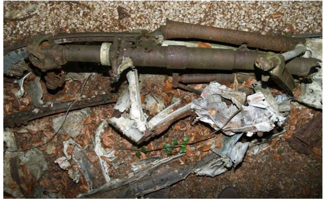
Le longeron principal de la voilure du Morane Saulnier 406 n° 684 d'Emile Boymond et une jambe de son train d'atterrissage