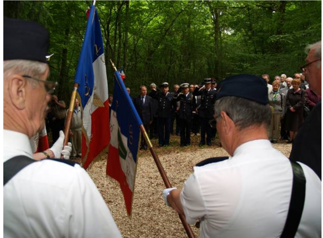
Dépôts des gerbes et minute de silence