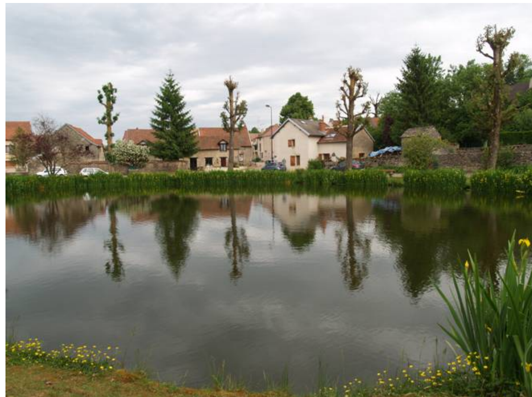
Deux vues du charmant village de Prenois qui est situé à une dizaine de kilomètres au nord-ouest de Dijon.