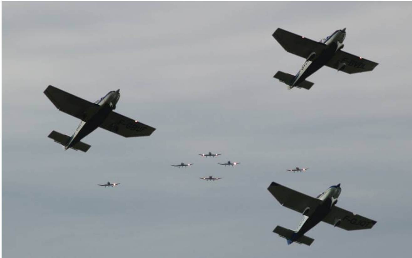
Les passages des avions de l'aéroclub de la Côte d'Or de Dijon-Darois au dessus de la stèle d'Emile Boymond (photomontages)