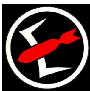
Insignes : Kampfgeschwader 53 « Legion Condor » et 3 ème Groupe (III./KG 53)